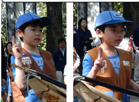
新しい仲間のNくん・Yくん